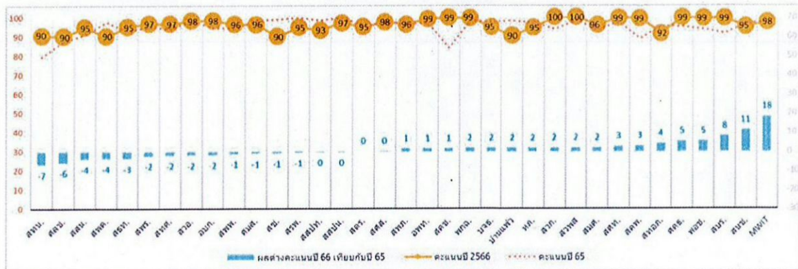
ภาพที่ ๑ ผลการประเมิน PO เรียงตามคะแนนเมื่อเทียบกับปีงบประมาณ พ.ศ. ๒๕๖๕

* อ.กพม. ในการประชุมครั้งที่ ๑/๒๕๖๗ เมื่อวันที่ ๒๔ มกราคม ๒๕๕๗ มีมติเห็นชอบผลคะแนนการประเมินประจำปีงบประมาณ พ.ศ. ๒๕๖๖ ของสถาบันทดสอบทางการศึกษาแห่งชาติ (องค์การมหาชน) ๙๖.๕๖ คะแนน