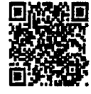
(ร่าง) แผนแม่บทฯ (ฉบับปรับปรุงความเห็น)

๑.๒ การดำเนินการปรับแผนแม่บทภายใต้ยุทธศาสตร์ชาติ สำนักงานฯ ในฐานะสำนักงานเลขานุการของคณะกรรมการยุทธศาสตร์ชาติ ได้ดำเนินการทบทวนปรับปรุงแผนแม่บทภายใต้ยุทธศาสตร์ชาติตามหลักการและแนวทางของมติคณะรัฐมนตรี เมื่อวันที่ ๑๐ พฤษภาคม ๒๕๖๕ เสร็จเป็นที่เรียบร้อยแล้ว โดยได้มีการเผยแพร่ (ร่าง) แผนแม่บทภายใต้ยุทธศาสตร์ชาติ (ช่วงที่ ๒ ของยุทธศาสตร์ชาติ พ.ศ. ๒๕๖๖ - ๒๕๘๐)) (ฉบับปรับปรุง) ผ่านทาง http://nscr.nesdc.go.th/hearing-master-plans-2022/ เพื่อให้ทุกภาคส่วนที่เกี่ยวข้องแสดงความคิดเห็นและให้ข้อเสนอแนะเพิ่มเติม กลับมายังสำนักงานฯ ภายในวันที่ ๓ สิงหาคม ๒๕๖๕ เพื่อสำนักงานฯ จะได้นำมาปรับปรุงแผนแม่บทฯ ให้มีความครอบคลุม ครบถ้วน สมบูรณ์ ก่อนจะนำเสนอต่อคณะกรรมการยุทธศาสตร์ชาติและคณะรัฐมนตรีพิจารณา และดำเนินการตามขั้นตอนต่อไป