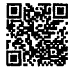
คู่มือแผนระดับ ๓

๔. ประเด็นที่ควรเร่งรัดเพื่อการบรรลุเป้าหมายของยุทธศาสตร์ชาติ ตามนัยของพระราชกฤษฎีกาว่าด้วยหลักเกณฑ์และวิธีการบริหารกิจการบ้านเมืองที่ดี พ.ศ. ๒๕๕๖ และที่แก้ไขเพิ่มเติม พ.ศ. ๒๕๖๒ และมติคณะรัฐมนตรีเมื่อวันที่ ๔ ธันวาคม ๒๕๖๐ กำหนดให้หน่วยงานของรัฐจะต้องดำเนินการจัดทำแผนปฏิบัติราชการประจำปี และราย ๕ ปี เพื่อเป็นกรอบในการดำเนินงานในการบรรลุภารกิจหลักของหน่วยงานของรัฐ และขับเคลื่อนเป้าหมายตามยุทธศาสตร์ชาติและเป้าหมายแผนระดับที่ ๒ ตลอดจนแผนระดับที่ ๓ อื่น ๆ ที่เกี่ยวข้องได้อย่างเป็นรูปธรรม ดังนั้น เพื่อให้การดำเนินการของหน่วยงานรัฐ ในปีงบประมาณ พ.ศ. ๒๕๖๖ และในห้วงที่ ๒ (ปี ๒๕๖๖ - ๒๕๗๐) ของแผนแม่บทภายใต้ยุทธศาสตร์ชาติ มีความชัดเจนและสามารถถ่ายทอดระดับเป้าหมายของแผนแม่บทภายใต้ยุทธศาสตร์ชาติ และแผนระดับ ๒ อื่น ๆ ที่เกี่ยวข้องไปสู่การปฏิบัติได้อย่างเป็นรูปธรรม ทุกหน่วยงานของรัฐจำเป็นต้องให้ความสำคัญในการจัดทำแผนปฏิบัติราชการประจำปี ๒๕๖๖ รวมทั้งแผนปฏิบัติราชการ ระยะ ๕ ปี (พ.ศ. ๒๕๖๖ - ๒๕๗๐) โดยดำเนินการตามหลักการและแนวทางของคู่มือการจัดทำแผนระดับที่ ๓ ที่สำนักงานฯ ได้เผยแพร่ไว้ผ่านทาง http://nscr.nesdc.go.th/planlevel3/ ให้สามารถประกาศใช้ได้ทันก่อนเริ่มต้นปีงบประมาณ ๒๕๖๖ เพื่อใช้เป็นกรอบแนวทางในการดำเนินงานของหน่วยงานต่อไป โดยขอให้หน่วยงานนำเข้าสู่ข้อมูลแผนปฏิบัติราชการฯ รายปีและราย ๕ ปีในระบบ eMENSOCR ภายใน ๓๐ วัน นับจากวันที่แผนฯ ได้มีการประกาศใช้ พร้อมทั้งเมื่อสิ้นสุดระยะเวลาของแผนปฏิบัติราชการฯ ขอให้จัดทำรายงานผลสัมฤทธิ์ฯ และนำเข้าสู่ข้อมูลในระบบ eMENSOCR เพื่อใช้ในการติดตาม ตรวจสอบ และประเมินผลการดำเนินงานตามยุทธศาสตร์ชาติต่อไป